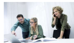
5.300 Mitarbeiter*innen in Verwaltung, Wirtschaft, Technik