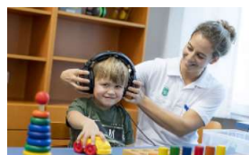
1.700 Mitarbeiter*innen im med.-technischen Dienst