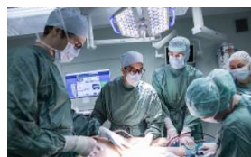
2.400 Mitarbeiter*innen in der Ärzteschaft