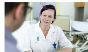
8.700 Mitarbeiter*innen in der Pflege