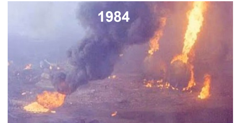
San Juanico (MEX)